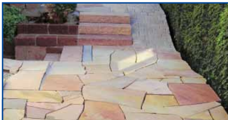
Het oppervlak moet volgens de plaatsingsregels zuiver en droog zijn.