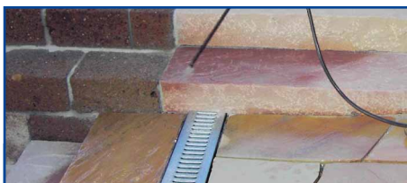
Ook verticale oppervlakken behandelen.

Deze voorbehandeling vergemakkelijkt het verwijderen van voegselresten achteraf en spaart tijd. In de zomerperiode kan men deze behandeling het best in de vroege voormiddag toepassen. Borstel eerst het losliggende vuil met een bezem weg. Hardnekkige vlekken met een speciale reiniger volgens de Lithofin verwerkingstabel verwijderen. Na het reinigen het oppervlak terug goed laten drogen.