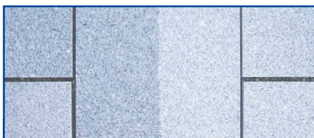
Met Lithofin Resin-EX verwijderd men resten van epoxyvoegenmortel.