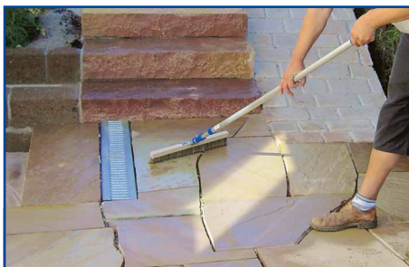
Lithofin VLEKSTOP >W< gelijkmatig verdelen.

Lithofin VLEKSTOP >W< ruim en gelijkmatig op het ganse oppervlak aanbrengen. Bij hellingen en trappen moeten ook de verticale delen behandeld worden.