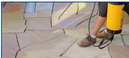
Het aanbrengen van Lithofin VLEKSTOP >W< met een vernevelaar.

Het natuur- of betonsteenooppervlak moet volgens de algemene plaatsingsregels geplaatst en gelegd zijn. Bij een voegwerk met drainerende functie is een aangepaste afwaterende ondergrond noodzakelijk. Volg steeds de richtlijnen van de voegmortel fabrikanten. De tegels moeten zuiver, vlek-vrij en droog zijn. De oppervlakte-temperatuur moet 10 - 25°C bedragen, max 30°C. Nooit producten verwerken bij warm weer in volle zon.