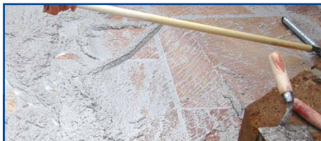
Voegwerk met epoxyhars-voegmateriaal.

Vlekken door opstijgend vocht kunnen door het rondom impregneren van de tegels verminderd worden. Voorwaarde voor een dergelijke behandeling is dat de tegels perfect droog en zuiver zijn en op een drainerende ondervloer geplaatst worden. Het impregneren van alle zijden van de tegels kan door het dompelen (ca. 30 seconden) of het instrijken met een rol of kwast. Productresten die niet worden opgenomen door het materiaal moeten voor het opdrogen afgeveegd worden. Voor het plaatsen oppervlakkig laten drogen : bij plaatsing met een natte impregnering op de tegel kan er een verzwakking ontstaan van de werking.