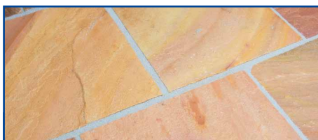
De vers gevoegde tegels worden snel gereinigd – ze zien er helder en zuiver uit.